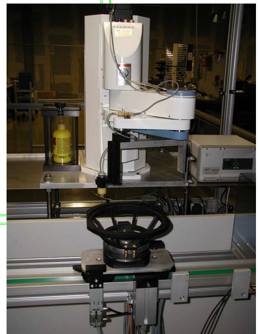
Automatisiertes Kleben von Membran und Kalotte in der Klebestation