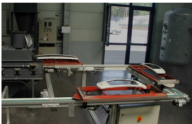
Richtungsorientierte Kurvenfahrt auf engstem Bauraum