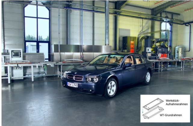
Leichtmetall - Gussteile für die PKW - Innenausstattung

Das staufähige Werkstückträger - System LFS mit WT - lang . Verschiedenartigste automatische Bearbeitungs - und Prüfschritte bei der Oberflächenveredelung von Leichtmetall - Gussteilen in der Automobil - Zulieferindustrie .